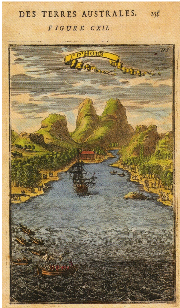
Gravure de Théodore de Bry, 1619.