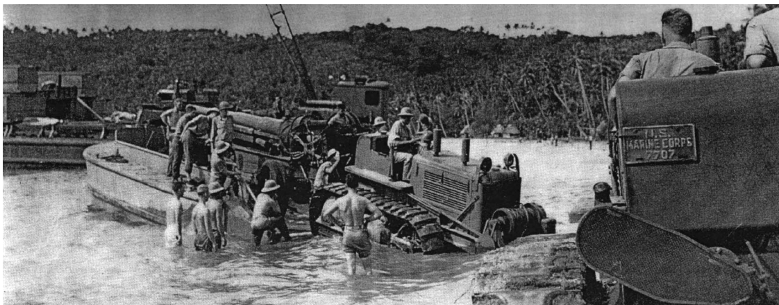
PHOTO 1. – Débarquement de matériel militaire américain dans la baie de Gahi (Wallis) en 1942 Cette photo publiée dans Life Magazine de New York le 22 août 1942 montre le déchargement d'une pièce d'artillerie tractée par bulldozer sur le rivage de Gahi, district de Mu'a. Un autre bulldozer en vue arrière, à droite du cliché, laisse apparaître son immatriculation au US Marine Corps . Cette photo, offerte par les Vétérans américains à la 'Uvea Museum Association de l'île Wallis, donne une idée visuelle du choc provoqué dans la population wallisienne par le débarquement d'engins et de matériel inconnus avant la guerre.