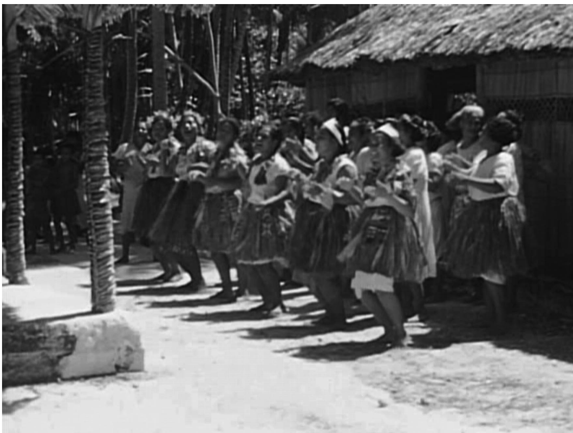
Photo 2. – Danse faka Niutao d'un groupe de jeunes filles de Wallis en 1943 (photo extraite d'un film 16 mm couleur – © 'Uvea Museum Association)

Cette photo doit être rapportée à un maholo , occasion festive informelle dans un cadre villageois ou familial, quelque part au sud de l'île (peut-être Gahi). Le genre de danse peut être identifié comme un faka Niutao , genre de danses répétitives exécuté debout par un groupe d'une vingtaine de danseurs et/ou danseuses.