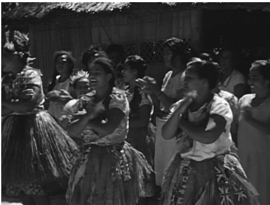
PHOTO 3. – Plan rapproché de danse faka Niutao exécutée par des jeunes filles wallisiennes en 1943 (extrait de film 16 mm couleur)

Les mouvements de mains sont de type vahe , ki mua et ki lalo et répondent à un enchaînement fixe sur un chant répétitif exécuté généralement trois fois à une cadence de plus en plus rapide. Dans la tenue vestimentaire des danseuses, on note l'utilisation de bandelettes flottantes attachées à la ceinture et faites de tapa décoré de motifs cruciformes. Celles-ci ont été remplacées depuis les années 1960 par du papier crépon, et communément désignées par l'expression muli pepa quand elles sont attachées au cou.